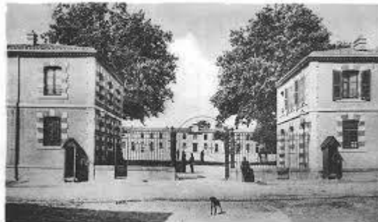
© CASTELNAUDARY - Entrée de la Caserne Lapostol.

Grace à de vieilles photos il nous aussi montré l'évolution de l'espace TUFFERY, de la caserne au cinéma, photos symbolisant quelques tranches de vie de notre ville que tout le monde connaît désormais grâce au CASSOULET .