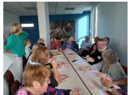
Groupe de Travail sur la relève des UR

À vos agendas : Une AGE et le prochain CA de l'IdF se tiendront à la Mairie du 9 ème à Paris le jeudi 6 février.