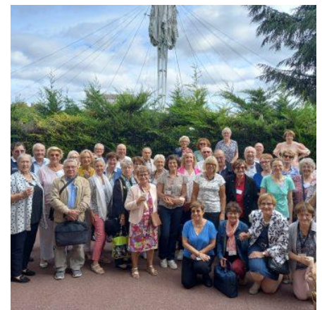
Les délégués Nationaux