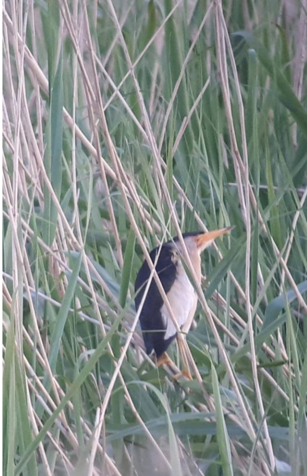
Un Blongios nain (de la famille du héron)