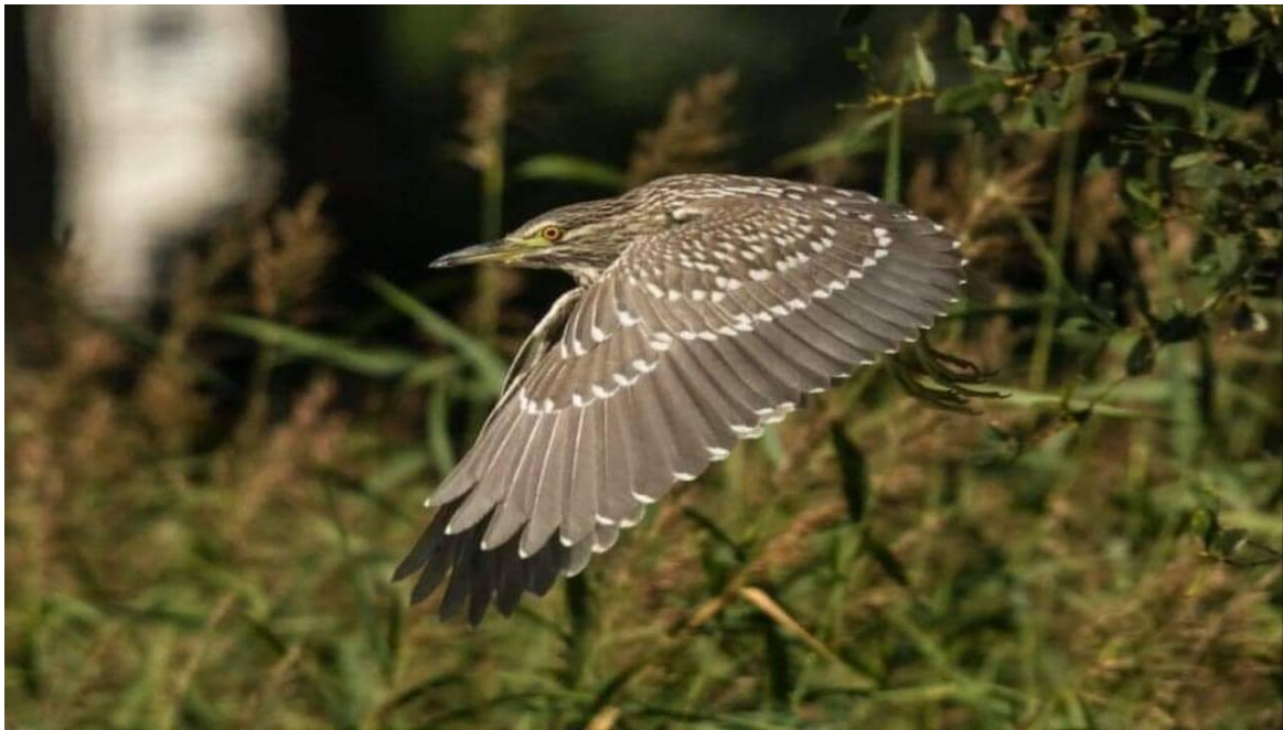
Un jeune héron Bihoreau gris ayant élu domicile près de la mare de La Prairie