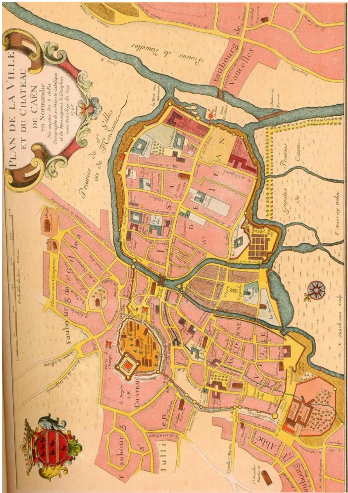
Un circuit de 5,1 Km (A&R)