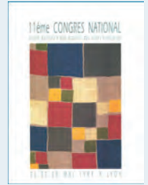
Lyon - 1994