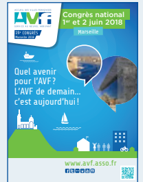
Marseille - 2018