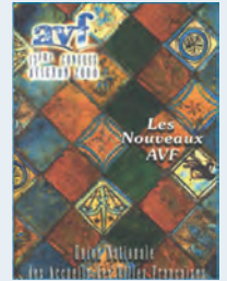
Avignon - 2000