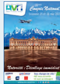
Toulouse - 2015