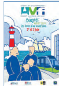
Brest - 2012