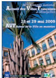
Montpellier - 2009