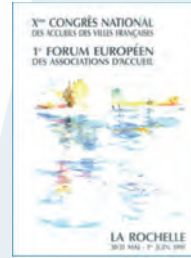
La Rochelle - 1991