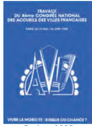
Paris - 1985