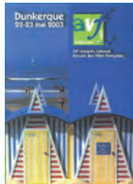
Dunkerque - 2003