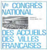
Marseille - 1976