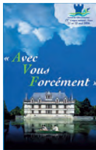
Tours - 2006