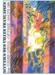
Cap d'Agde - 1988