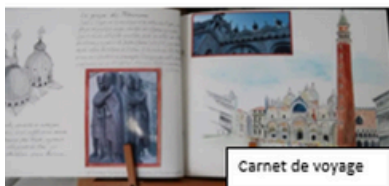
Carnet de voyage