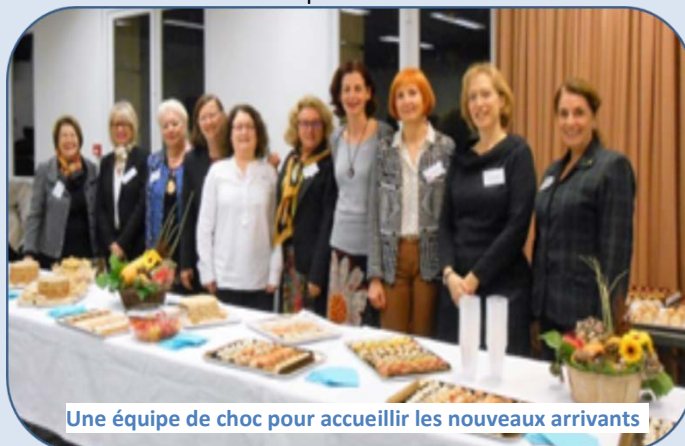
Une équipe de choc pour accueillir les nouveaux arrivants

chaque rentrée de septembre un cycle de 5 séances qui permet de faire découvrir aux étrangers les particularités de la vie à la française et d'échanger des informations pratiques pour les aider à mieux s'intégrer et créer rapidement du lien.