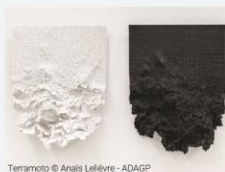
Terramoto © Anaïs Lelièvre - ADACP

Anaïs LELIÈVRE s'emploie à faire l'expérience du contexte et invente des volumes qui participent à les évoquer. Le dessin, les installations et les céramiques forment des architectures utopiques, tel un chantier ouvert à tous qui ne cesserait de se construire.